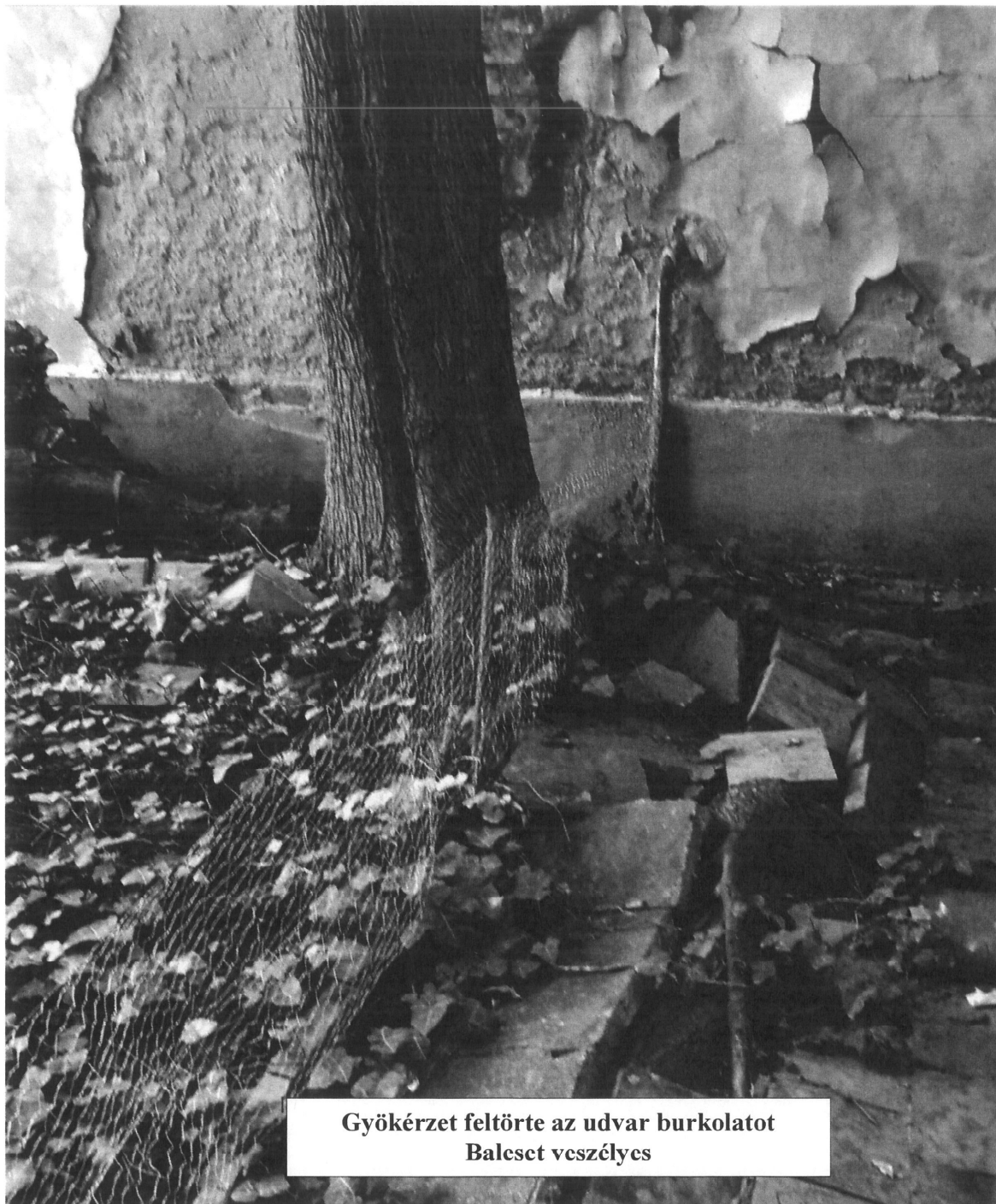
Gyökérzet feltörte az udvar burkolatot Baleset veszélyes

gyökérzete az udvar burkolat járófelületét feltörte, a kialakult nagy mértékű egyenletlenség botlás, balesetveszélyes állapotot hozott létre. Az épület földszinten lévő lakások megközelíthetősége az ott lakó (idősek, kisgyermekes családok) részére a jelen állapotban nem biztonságos.