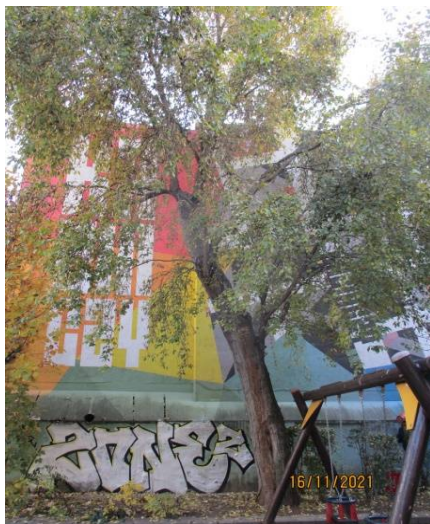
a fa és környezete