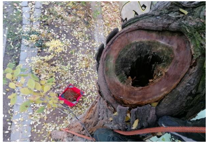
a vezérsudár sérülései: