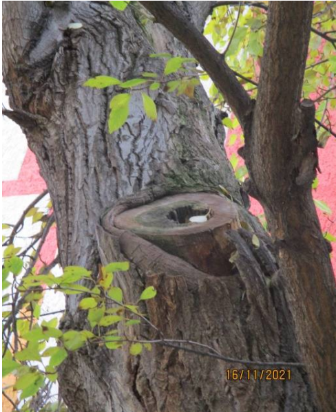
a korona alap sérülése: