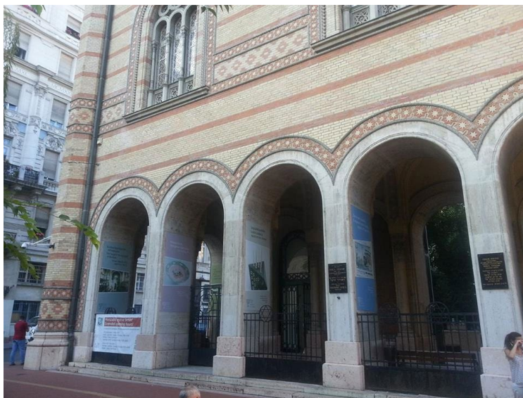
Az emléktábla tervezett helyszíne, a Dohány utcai Zsinagóga árkádsora

Erzsébetváros Önkormányzata a MAZSISZEM (Magyar-Zsidó Szabadságharcosokért Emlékbizottság) kezdeményezésére az 1956-os Forradalom és Szabadságharc zsidó származású hőseire emlékező táblát kíván elhelyeztetni az '56-os emlékévre való tekintettel. Az emléktábla tervezett helyszíne a 1074 Budapest, Dohány u. 2. szám alatt lévő Dohány utcai Zsinagóga árkádsorának egyik oszlopa. Megjelenésében az eddigiekben ott elhelyezett táblákhoz szeretnénk igazodni. Az oszlopok a 70x45x2 cm és 110 x 45x2 cm márvány vagy gránit tábla elhelyezését teszik lehetővé. A tábla elkészítését – többek közt a helyszín megjelölése érdekében - a MAZSIHISZ – el történő egyeztetés fogja megelőzni.